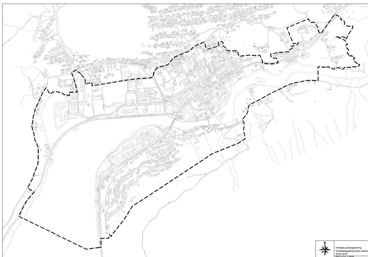
Figur 1: Førebels planavgrensing for områderegulering for Stryn sentrum.

I samband med oppstart av planarbeidet er førebels avgrensing sett til området Grønevik-Sentrumsområdet-Riise bru-Visnes. Dette er noko større ein det som blei skissert i planstrategien, dette er delvis årsaka til at planen no er ein områdereguleringsplan og ikkje detaljregulering. Endeleg avgrensing vil bli fastset i planprogrammet.