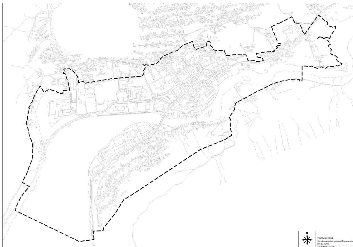
Figur 1: Planavgrensing for områderegulering for Stryn sentrum.

I samband med oppstart av planarbeidet er planavgrensinga sett til området Grønevik-Sentrumsområdet-Riise bru-Visnes. Dette er noko større ein det som blei skissert i planstrategien, dette er delvis årsaka til at planen no er ein områdereguleringsplan og ikkje detaljregulering.