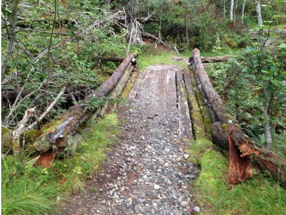
Falleferdig Hynnelsbru slik ho såg ut fram til 2016.