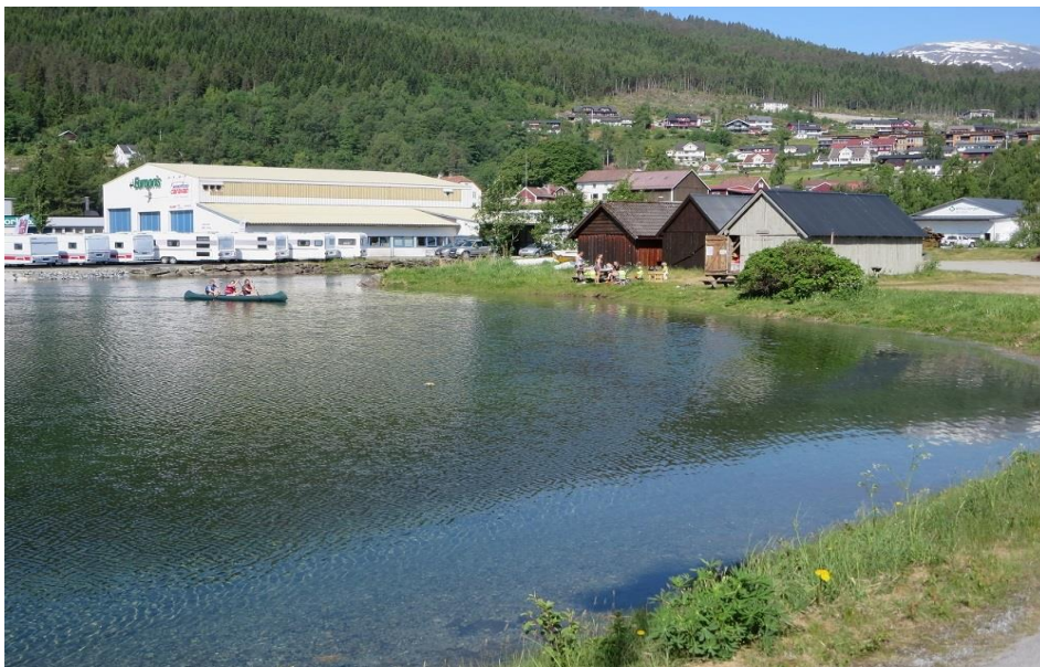
Tonningøyra med høve til bading og kanopadling.

Turstien går opp langs elvekanten på Vikaelva til Vikavegen og vidare opp langs elva til Sandbakk aktivitetsområde.